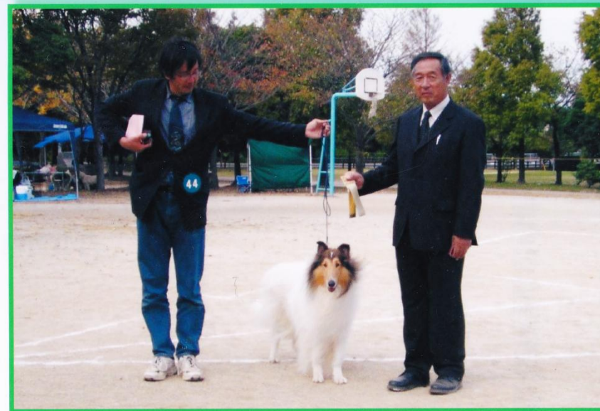
G-Ch.完成♪ (北九州市洞北緑地公園 4 Nov. 2007)