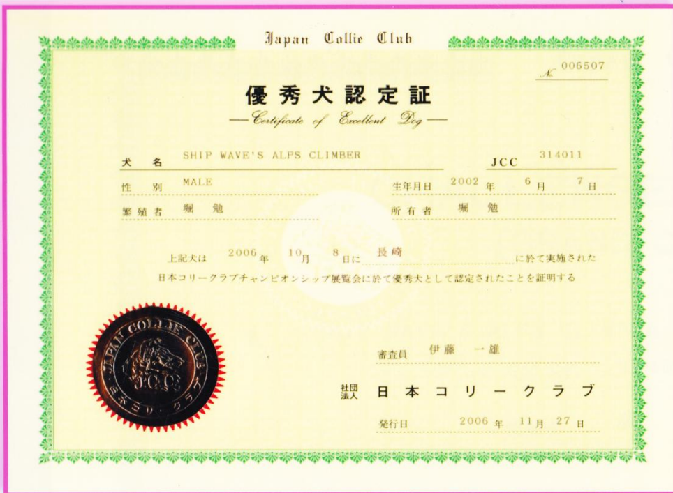
Ch.完成♪ (諫早市上山公園 8 Oct. 2006)